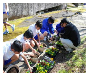
プランターに苗を植えつける1年生

14日(木)1年生全員で「花いっぱい運動」の取組を行いました。この行事はパンジーやピオラなど花で校内をいっぱいにして新入生を迎えようという趣旨で、毎年行われています。この日は約100個のプランターに用意した苗を植え付け、校門から校舎に向かう通路に並べました。4月9日の入学式の頃は色鮮やかな花が新入生を迎えることとなります。