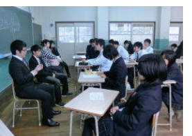
卒業生から話を聞く2年生

18日(月)卒業したばかりの3年生が、後輩に進路選択についての自分の経験を伝えていこうという取組があり、進路希望ごとに「就職」「大学」「短大」「専門学校」の3つのグループに分かれた2年生が話を聞きました。参加してくれた17名の卒業生からは自らの受験勉強についての体験談や、就職の面接試験の際に気をつけておくことなど、様々なためになる話を聞かせてもらうことができました。参加いただいた卒業生の皆さんありがとうございました。