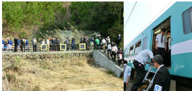
電車を下車し避難路を通して高台へ避難