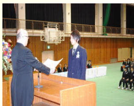
卒業証書を受取る卒業生

1日(金)、平成24年度卒業証書授与式が挙行され、普通科51名が古座校舎から巣立っていきました。