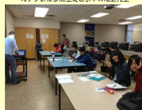
パニア高校での授業の様子

本校は旧古座高校時代に同市にあるパニア高校と姉妹校提携を結んでおり、生徒たちは同校で授業を受けたり、パティーとしてついでくれた生徒にサポートしてもらいながら、充実した海外生活を体験しました。一行は21日(木)夜、全員元気に帰校しました。