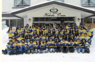
ホテル前で記念写真

11日(火)から4泊5日の日程で、2年生のスキー研修修学旅行があり、65名全員が参加しました。初めての雪に苦労しながらも生徒は熱心にレッスンに取組み、スキー、スノーボードともに、基本的な技術を身につけることができました。帰り道、大雪のため高速道路が閉鎖されるなどのトラブルがありましたが、3時間程度の遅れで無事帰ってくることができました。