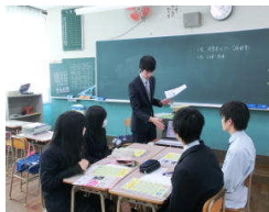
分野別ガイダンス

13(水)午後、1年生で進路学習会があり、講演と職業別のガイダンスを行いました。講師の先生からは、就職後の早期離職や、大学、専門学校等の中途退学は、選択の際の見通しの甘さや思慮不足、また基礎学力の不足などが原因であることが多いという話がありました。将来の進路選択を考えるうえで有意義な時間になったようです。《生徒の感想より》