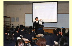
DVD鑑賞後の振り返り学習

20日(木)、「いじめ」をテーマにした人権LHRがありました。県人権啓発センターから借用したDVD「いじめから逃げない」を見たあと、ワークシートを使って振り返り学習を行い内容を深めました。