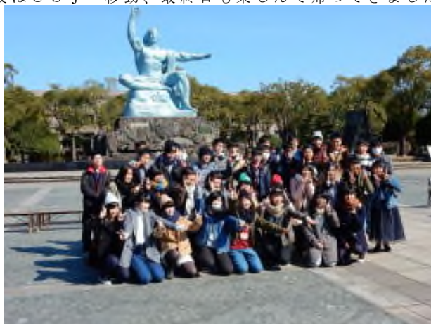
旅行の写真などは、後日HPにアップします。

3日目は熊本城、湯布院、別府地獄めぐりを楽しんだ後、夜行フェリーで大阪南港へ。下船時に部屋のカギをなくして慌てていた班もありましたが何とか下船。その後はUSJへ移動、最終日も楽しんで帰ってきました。